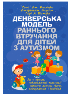
Денверська модель раннього втручання для дітей з аутизмом