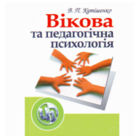
Вікова та педагогічна психологія. 2-ге видання.