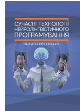
Сучасні технології нейролінгвістичного програмування