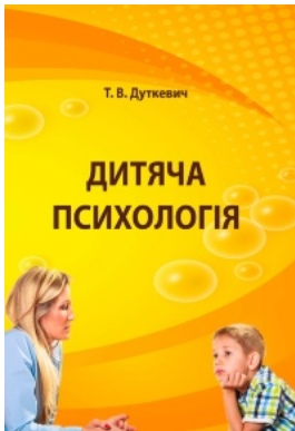
Дитяча психологія. Практикум