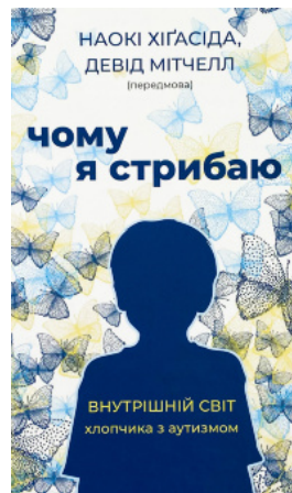
Чому я стрибаю. Внутрішній світ хлопчика з аутизмом