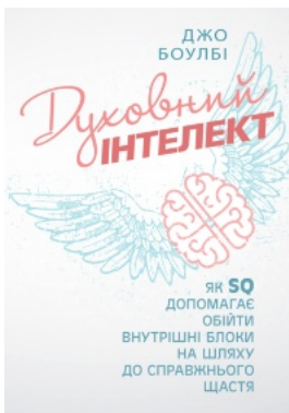
Духовний інтелект. Як SQ допомагає обійти внутрішні блоки на шляху до справжнього щастя