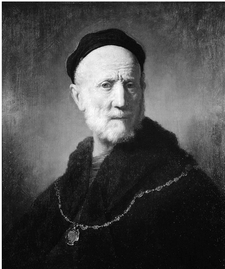
Рембрандт. Отец (1631).