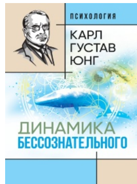
Динамика бессознательного: [сборник]