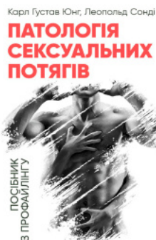
Патология сексуальных потягив. Посібник з профайлінгу