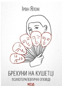
Брехуни на кушетці. Психотерапевтичні оповіді