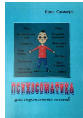
Психосоматика для нормальных психов