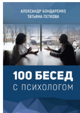
100 бесед с психологом (рос.)