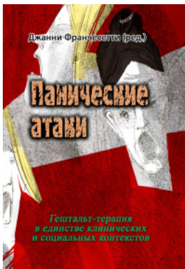
Панические атаки (Гештальт-терапия в единстве клинических и социальных контекстов)