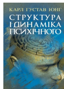
Структура і динаміка психічного