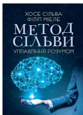
Метод Сільви. Управління розумом