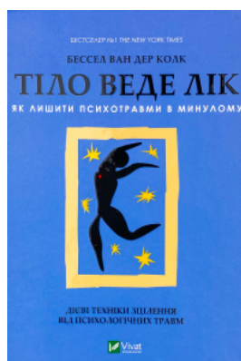
Тіло веде лік. Як лишити психотравми в минулому