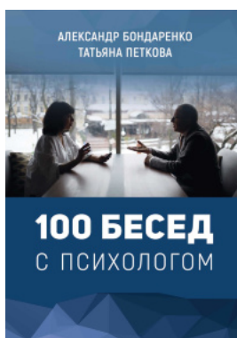
100 бесед с психологом (рос.)