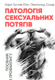
Патологія сексуальних потягів. Посібник з профайлінгу