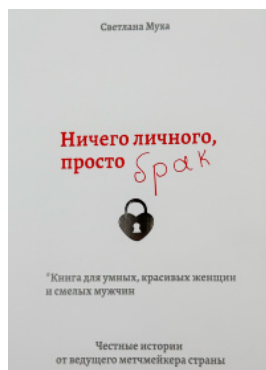
Ничего личного, просто Брак

Перейти до категорії Аналітична психологія