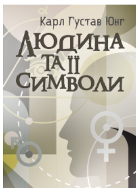
Людина та її символи