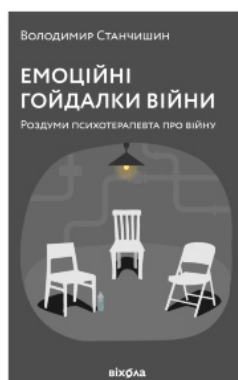
Емоційні гойдалки війни. Роздуми психотерапевта про війну