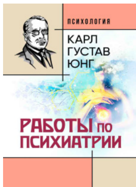
Работы по психиатрии