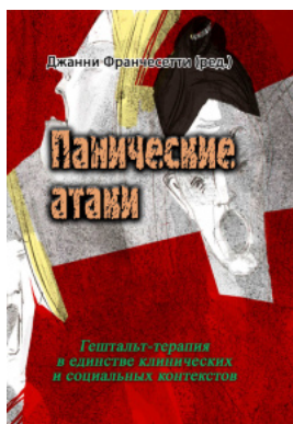
Панические атаки (Гештальт-терапия в единстве клинических и социальных контекстов)