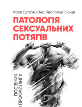
Патологія сексуальних потягів. Посібник з профайлінгу

Перейти до категорії Аналітична психологія