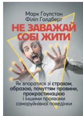
Не заважай собі жити. Як впоратися зі страхом, образою, почуттям провини, прокрастинацією і іншими проявами саморуйнівної поведінки