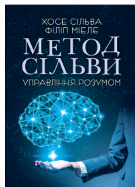
Метод Сільви. Управління розумом