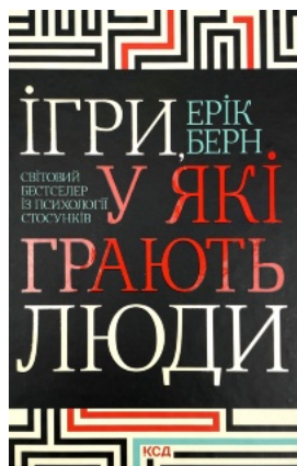
Ігри, у які грають люди