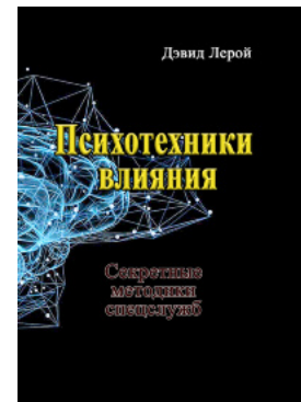
Психотехники впливння. Секретні методи спецслужб